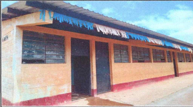
Foto 1: SE OBSERVA DE DETERIORO DE LA ESTRUCTURA POR TANTO DESPRENDIMIENTO PINTURAS EN LA PAREDES EN EL MODULO 1